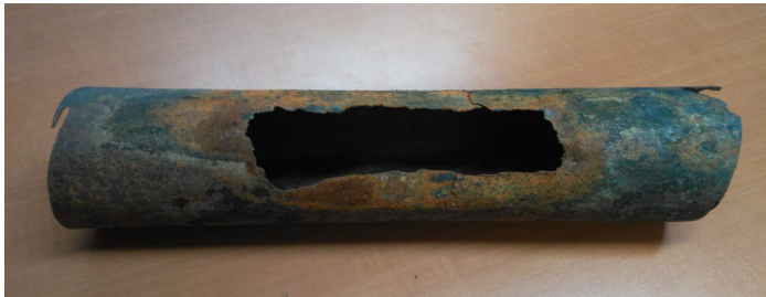
Photo de la conduite d'eau

Pour votre information, pour pouvoir informer une population sur un incident, il faut en identifier la cause. Nous préférons identifier et analyser le problème pour essayer de le résoudre sur l'instant T avant de communiquer. C'est peut-être le « jeu » mais nous sommes humains avant tout. Merci.